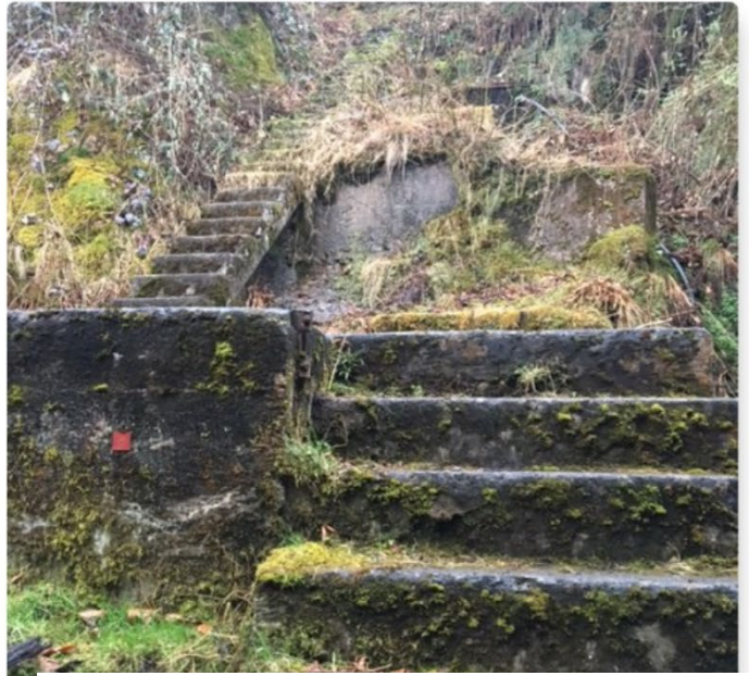
Punto di partenza