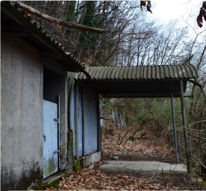
Punto di arrivo